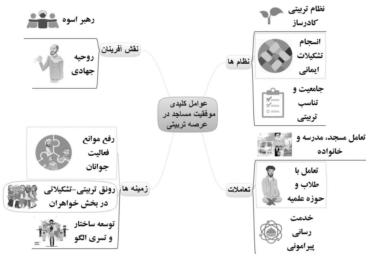
نمودار ۲: شبکه مضامین عوامل کلیدی موفقیت مساجد در عرصه تربیتی