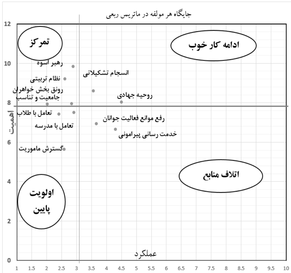
نمودار ۳: جایگاه مؤلفه‌ها در نواحی چهارگانه ماتریس ربعی